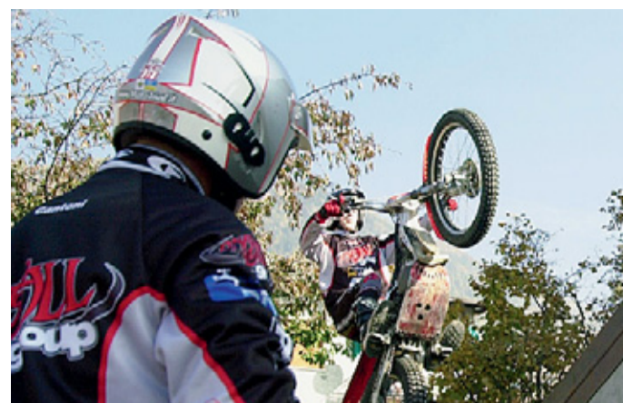
Una delle recenti prove del campionato regionale trial